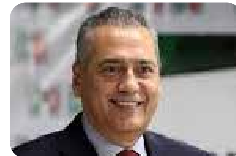
Manlio Fabio Beltrones Rivera