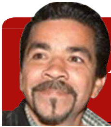
Columna de Arturo Soto Munguía