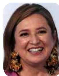
Xóchitl Gálvez Ruiz

La excandidata presidencial Xóchitl Gálvez Ruiz, denunció en su cuenta de X, que la presidenta de la república, Claudia Sheinbaum Pardo, cubre a la gobernadora de Veracruz, Rocío Nahle, ya que absuelve a sus cercanos que se involucraron en escandalosos actos de corrupción en la Construcción de la Refinería de Dos Bocas, que originalmente el presupuesto marcaba 8 mil millones de dólares, pero al final resultó que el costo hasta el momento es de 19 mil millones de dólares, pero todavía más, porque a tres años de haber sido inaugurada, no ha refinado un solo litro de combustible. Xóchitl Gálvez, se refirió a la visita que hizo la presidenta de la república, al estado de Veracruz, donde destacó el papel de Nahle cuando fue secretaria de Energía, lapso en el que se construyó dicha refinería, aclarando Gálvez que en ese periodo Nahle entregó contratos millonarios a personas cercanas a ella, como Juan Carlos Fong Cortés, pero no hay nada que se pueda hacer porque ambos cuenta con la protección presidencial.